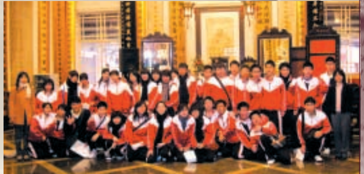
實地考察東華醫院禮堂。 A visit to the Assembly Hall of Tung Wah Hospital.