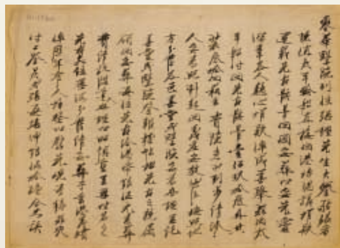
從珍貴的義莊文獻檔案，可見東華動用龐大資源為世界各地華人安排原籍安葬。 The invaluable archives showed that Tung Wah engaged huge resources to arrange bone repatriation of Chinese from all over the world to their birth place on the Mainland.