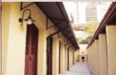
莊房簷篷的修復是其中一個最獲好評的部分。 The restoration of the roof of the rooms is one of the highly commended aspects.

世紀中至二十世紀華人遷徙的問題，包括大量華人由內地到外埠工作的情況、海外華人會館的發展歷程及華人身故後骨殖透過東華義莊運回原籍下葬的安排。冼博士約兩年前有一段時間讀到很多美洲舊報章有關東華提供原籍安葬服務的報導，當時已提點我做工夫；今次義莊修復工程獲獎，她第一時間來電致賀，又再囑我加倍努力，使我深受鼓舞。每次跟她討論我們與亞洲研究中心合作進行中的歷史研究計劃和向她報告文物館其他進展，都會聽到她提及東華三院對早期香港社會的重大貢獻，以及感受到她對當年總理的欽佩。