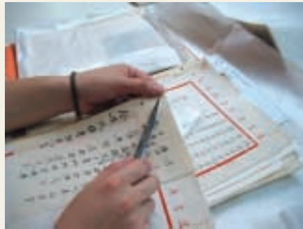
文物館職員為拍攝文獻做準備工夫。 Museum staff prepared for the shooting of archives.