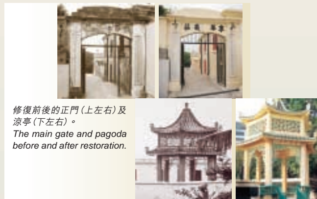
修復前後的正門(上左右)及涼亭(下左右)。 The main gate and pagoda before and after restoration.

回想起來，這幾年主持修復工程的幾位靈魂人物一些決策，竟為東華以至本港歷史文化界帶來重大契機。首先是近年醉心研究東華歷史的梁錦芳執行總監認為，重修東華義莊對東華和香港都有深遠的意義，以廣闊的視野將計劃定位，這就決定了工程的深度和細緻度。接着羅志偉物業總主任引導董事局選擇最合適的項目建築師，一同規劃、推動和監督工程，並為每一階段工作做紀錄，最後製作一份文字和圖片專輯交給文物館。與此同時，吳志榮社服總主任邀得嶺南大學歷史系助理教授劉智鵬博士為義莊進行一項詳細的資料搜集，期間再按社服委員會決議，邀請我協助尋找專家研究義莊為華人提供的原籍安葬服務。