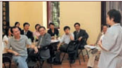
學者專家參觀義莊，聆聽職員簡介日常運作。 Scholars and experts paid a visit to Coffin Home and were briefed on the daily operation of the home.

關於義莊修復工程，我也請到另一位東華三院文物館顧問康樂及文化事務署總館長（修復）陳承緯先生親到義莊參觀品評。陳總館長表示，他雖不知道從前義莊的情況，但可以想像修復工程帶來的挑戰。他相信施工期間現場仍不斷進行研究工作，東華、項目建築師和承建商一定也曾處理很多複雜的問題。工程的整體規劃、處理手法、流程監督以及工藝考證都值得讚賞。